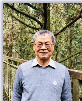
許世壁 Sze-Bi Hsu

獲選理由為其在計算流體力學研究上的傑出貢獻，特別是在有關Navier-Stokes方程在不同流體結構的算法上的一系列重要成果。